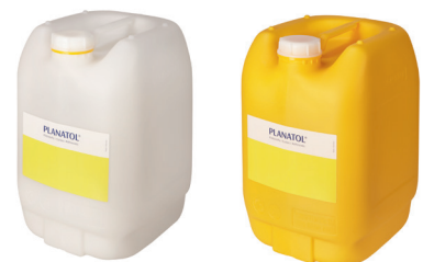
Falzklebstoffe und Falzbefeuchungskonzentrat

Mehr über die Klebstoffe und Falzbefeuchungskonzentrate erfahren Sie aus unserem Prospekt „Planatol Falzklebstoffe“.