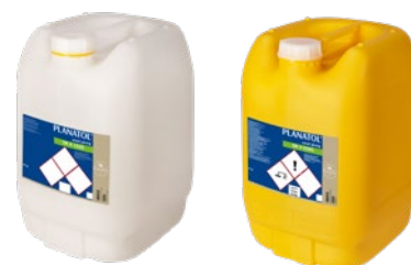
Falzklebstoffe und Falzbefeuchtungskonzentrat

Mehr über die Klebstoffe und Falzbefeuchtungskonzentrate erfahren Sie aus unserem Prospekt „Planatol Falzklebstoffe“.