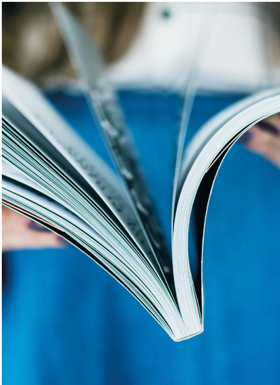
Incollaggi durevoli e di Alta Qualità – anche su impegnative superfici